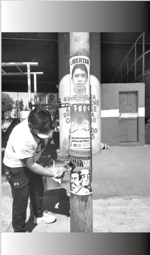
Ocupar el espacio con la lucha popular

Sin embargo, el ejercicio del derecho humano a la protesta social siempre ha sido limitado, aun en los gobiernos que se dicen democráticos, repartir un volante, pegar un cartel exigiendo la presentación con vida de los detenidos desaparecidos es equiparable a repartir “propaganda” y este acto es merecedor de multa o de ser detenido por hasta 36 horas, basta ver la Ley de Cultura Cívica de la Ciudad de México o el Bando de gobierno de Texcoco, Estado de México, para confirmarlo.