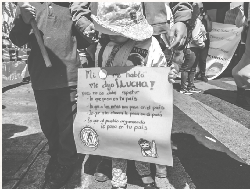
Marcha realizada en Tláhuac por los derechos de la mujer trabajadora

Éste hecho fue un factor que llevó a la dictadura a su final. Por esto, desde 1981 en el Primer Encuentro Feminista de Latinoamérica y el Caribe, en Bogotá (Colombia), la fecha de su ejecución extrajudicial se convirtió en